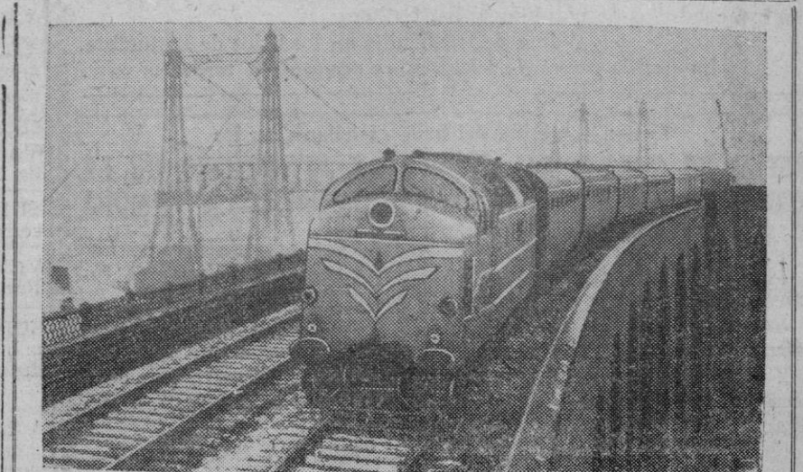
Nuevo modelo de locomotora inglesa, eléctrica y de gran potencia, que hace el servicio entre Londres y Edimburgo, y que puede desarrollar una velocidad máxima de ciento ochenta kilómetros por hora