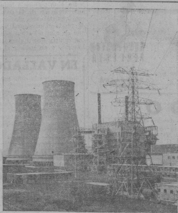
Vista general de Calder Hall, la primera central electroatómica en gran escala del mundo, que fué inaugurada oficialmente por Su Majestad la Reina Isabel el día 17 de Octubre de 1956. En el primer plano puede verse uno de los pilones que transportarán la electricidad a las viviendas y fábricas británicas

Desde Nickelsdorf se informa que doce periodistas occidentales, hasta ahora sin identificar, han sido capturados por los rusos en Magyarovart, y que los funcionarios austriacos están tratando de conseguir su libertad.