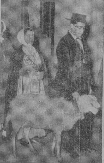
Hay muchos sitios en el mundo donde las tradiciones de Navidad se guardan en toda su pureza. Aquí tenemos una estampa de Cannes, en la que unos campesinos acuden con su cordero a la Misa del Gallo para ofrecerlo al Niño Dios.

Le apoyan los estudiantes, jefes sindicales y Policía de Arequipa