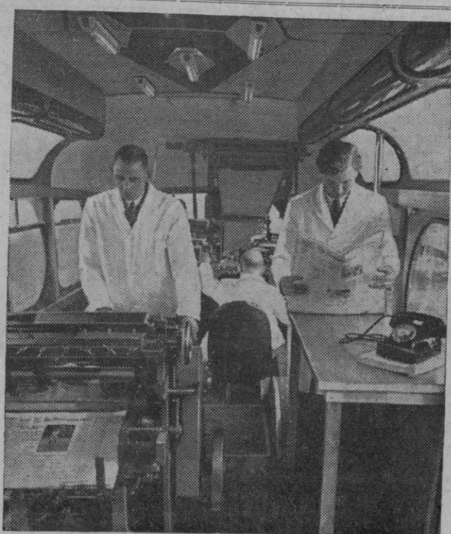
Ustedes habrán visto muchas imprentas; pero es posible que como esta ninguna, pues por aquí no se editan. Se trata de una imprenta ambulante, dotada de todos los adelantos modernos y que permite tirar un periódico en cualquier lugar con las noticias del último momento

Temperaturas extremas: Máxima de 21 grados, en Murcia, y mínima de uno bajo cero, en León.—Cifra.