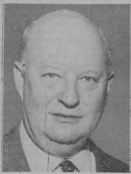
Paul Hindemith, célebre compositor alemán que cumplirá el próximo día 16 sus sesenta años de edad