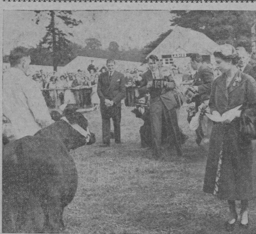
La Reina de Inglaterra, durante su visita a la Exposición de Ganado en Wollaton Park. Se exhibieron más de tres mil quinientos ejemplares

La campana lleva el nombre de Santa Rosa, lugar de residencia de la Misión, cuyo nombre recuerda a la esposa del donante, ya fallecida.—Cifra.