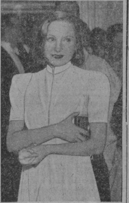
Estampas retrospectivas de la historia del cine. El nombre de esta señorita es el de Elizabeth Bergner, que guarda celosamente bajo el brazo el estuche que contiene uno de los galardones conseguidos con su arte interpretativo. Elizabeth en el histórico momento en que fué retratada esperando a ser presentada a la reina Mary de Inglaterra... De ayer.

Las provincias Vascongadas y Cantabria celebrarán su Congreso en Gijón; Cataluña, en Barcelona; Galicia, en Vigo; Asturias, León y País Vasco, en Oviedo; Levante y Baleares, en Valencia; Castilla la Nueva y Aragón, en Albacete; Aragón, Na-