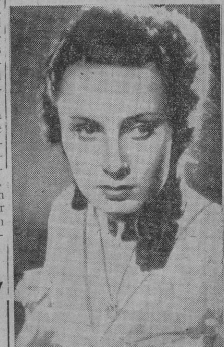
Hace tiempo, sí. Pero esta es la "entonces" famosa actriz alemana Lidia Barova. ¿No la recuerdan? Pues no es de extrañar que alguno de ustedes la haya visto más de una vez en la pantalla

En el banco del Gobierno se hallan los ministros de la Gobernación, Hacienda, Asuntos Exteriores, Agricultura, Obras Públicas, Comercio, Ejér-