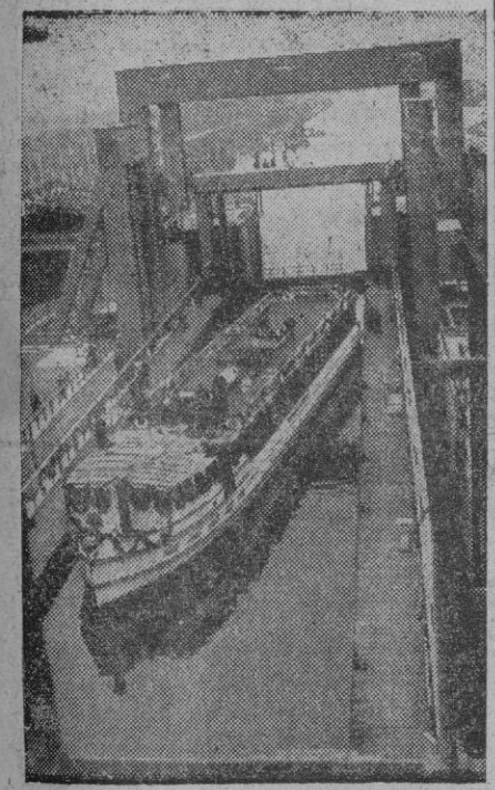
Con todo su aspecto un tanto de película, no se trata ni más ni menos que del simple paso de un buque por un canal en un momento de cruzar una de las esclusas

El atrevido navegante, que es un neoyorquino de sesenta y un años, se encuentra en buen estado de salud. No quiso abandonar la balsa cuando un grupo de embarcaciones acudió a las afueras del puerto a darle la bienvenida, pero permitió ser remolcado hasta el muelle.—Efe.