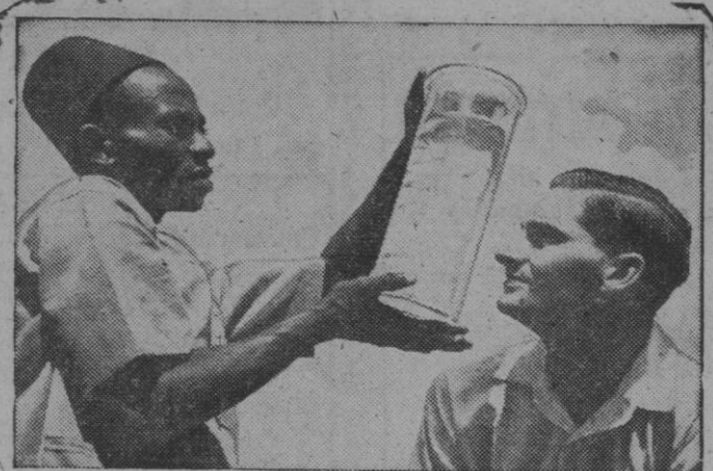
¿Qué tendrá el negrito en ese frasco para excitar así esa curiosidad del otro que lo contempla? Pues nada más que unos pececillos comedores de mosquitos, y criados en unos laboratorios para hacer estudios sobre la enfermedad del paludismo

No; no la duele la cabeza, ni tiene ninguna grave preocupación, a ser la de sacar mejor jornal por sus llantos. Porque ella es una planidera profesional de Carelia. Vende sus llantos y sus lamentaciones y sus gritos en los entierros, enfermedades graves, etcétera. Oficio antiquísimo que a nosotros parecerá muy extraño, pero que aún se conserva en ciertos países