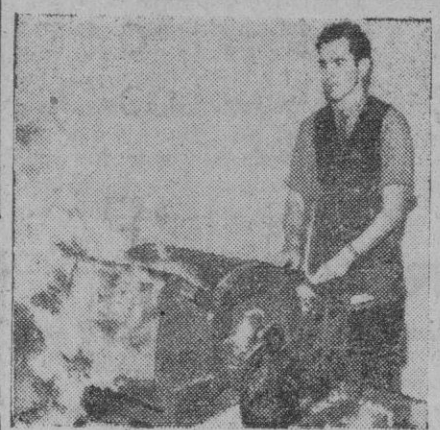
También Dinamarca, por pequeña que sea, tiene su industria textil y con destino a ella fabrica las más variadas máquinas.

El Cairo, 29 (4 t.).—El ministro de Orientación Nacional, Salem, ha indicado que el Consejo Revolucionario permanecerá en el Poder después del 24 de Julio, fecha fijada para la celebración de las elecciones para la Asamblea Constituyente.