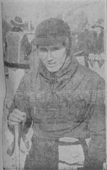
Esta fotografía viene muy bien para este tiempo. Y, a la vez, servirá de estímulo para nuestros esquiadores. Porque esta señorita alemana no tiene sólo el mérito de estar muy elegantemente vestida, sino que se trata de una joven esquiadora alemana que ha sido campeón mundial en tres ocasiones. ¡Buena deportista; de las de verdad!