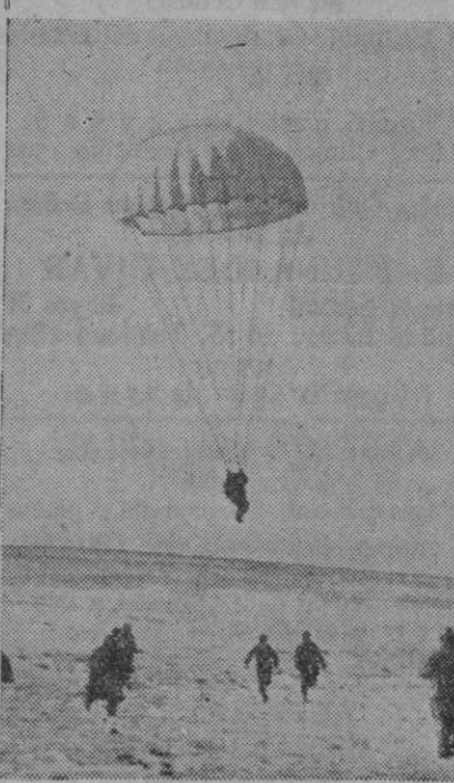
En el arriesgado ejercicio de la aviación, se encuentra la práctica del paracaidismo y valor—si, señores; valor—se precisán para ejecutar los arriesgados saltos al espacio.

En cada lanzamiento brota una incógnita: ¿Se abrirá el artefacto? Lo que afirma más la arriesgada profesión.