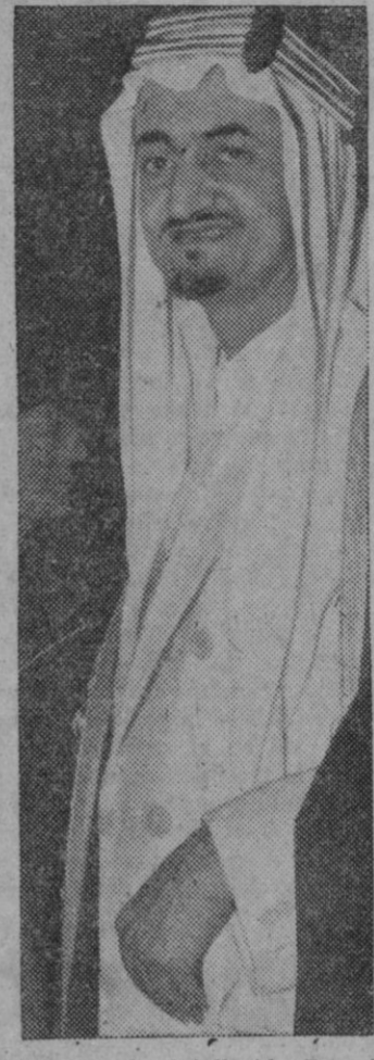
Ibn Saud, el fallecido Rey de Arabia Saudí

El Rey Ibn Saud tenía 73 años de edad y gobernaba seis millones de personas. El mes pasado se anunció que estaba enfermo en Taif, cerca de La Meca. Le atendieron dos médicos franceses de angina de pecho. Le sucede en el trono su hijo, el Emir Saud Ibn Abdul Aziz, de 52 años, que es jefe del Gobierno y comandante en jefe de las fuerzas armadas de Arabia Saudí. La sucesión es automática.