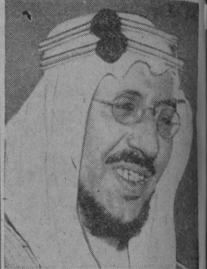
Emir Saud, nuevo Soberano