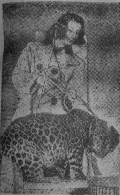
En cuanto a gustos, nada hay reglamentado. Por ello, las mujeres suelen hacer los suvos con harta frecuencia y entera libertad. Como, por ejemplo, la artista cinematográfica Katherine Hepburn que, durante una temporada, le dió por pasearse por Hollywood con un hermoso leopardo de acompañante.

Trieste, 19 (4 t.)—Un reforzado ejército yugoslavo se encuentra en estado de alarma en la frontera italiana. Los observadores militares que han visto este ejército en acción durante las mayores maniobras celebradas en la postguerra por los yugoslavos, cerca de Zagreb, dicen que se trata de tropas bien disciplinadas, aunque carecen de armamento pesado y de suministros técnicos del último modelo.