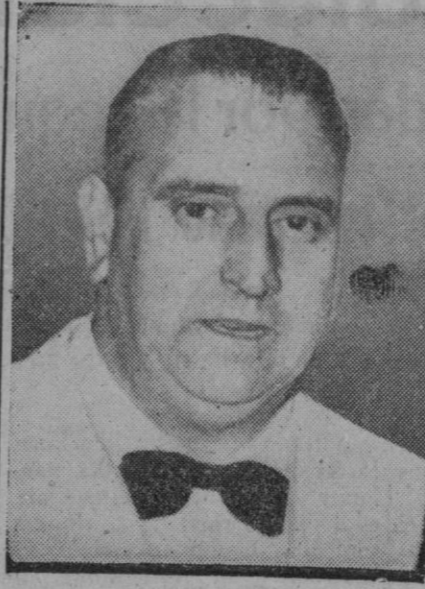
El ministro de Asuntos Exteriores, señor Martín Artajo

—Fue a partir del año Santo de 1950, cuando se pensó en la conveniencia de sistematizar todo lo concertado; y sólo entonces, el embajador, a la sazón el señor Ruiz-Jiménez, cumpliendo instrucciones del Gobierno, elevó a Su Santidad la propuesta de que se establecieran negociaciones para llegar a un nuevo acuerdo general, y, habiendo accedido a ello el Sumo Pontífice, presentó el embajador al propio Padre Santo, un día de Abril de 1951, con una carta del jefe del Estado español, Generalísimo Franco, para Su Santidad, el anteproyecto elaborado por el Gobierno.