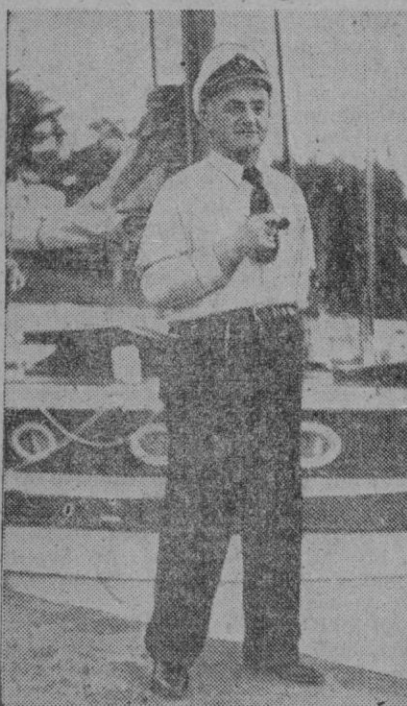
Aquí le tienen: cachazudo, en mangas de camisa, con la gorra echada hacia atrás y la "cachimba" en la mano. Es, nada menos y nada más, un capitán de barco. Aunque así, a primera vista, pareciera se ha "vestido" para colocarse ante un fotógrafo del minuto. Sin embargo, nosotros les damos palabra de que es un capitán "de verdad".