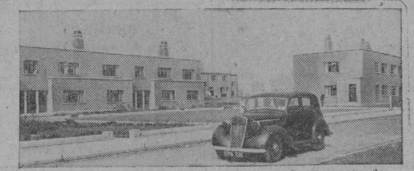
Inglaterra no quedó muy bien parada tampoco después de la última gran guerra. En Glasgow, por ejemplo, importante zona carbonífera, las bombas produjeron grandes destrozos. En la fotografía se ven algunos de los bloques de viviendas, levantados con la mayor rapidez.