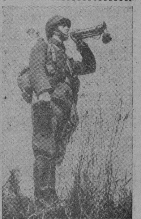
El atuendo militar, completo, y la marcialidad del soldado, dan un aire de seguridad y poderío a esta figura que se recorta, ante el paisaje, empujando la trompeta que marcará a los demás soldados la pauta a seguir. En las maniobras no se mira que estamos en paz. Se «hace» la guerra, se desarrollan tácticas, se estudian estrategias. La preparación del militar es dura y completa. Todo en bien de la Patria.

En las maniobras no se mira que estamos en paz. Se «hace» la guerra, se desarrollan tácticas, se estudian estrategias. La preparación del militar es dura y completa. Todo en bien de la Patria.