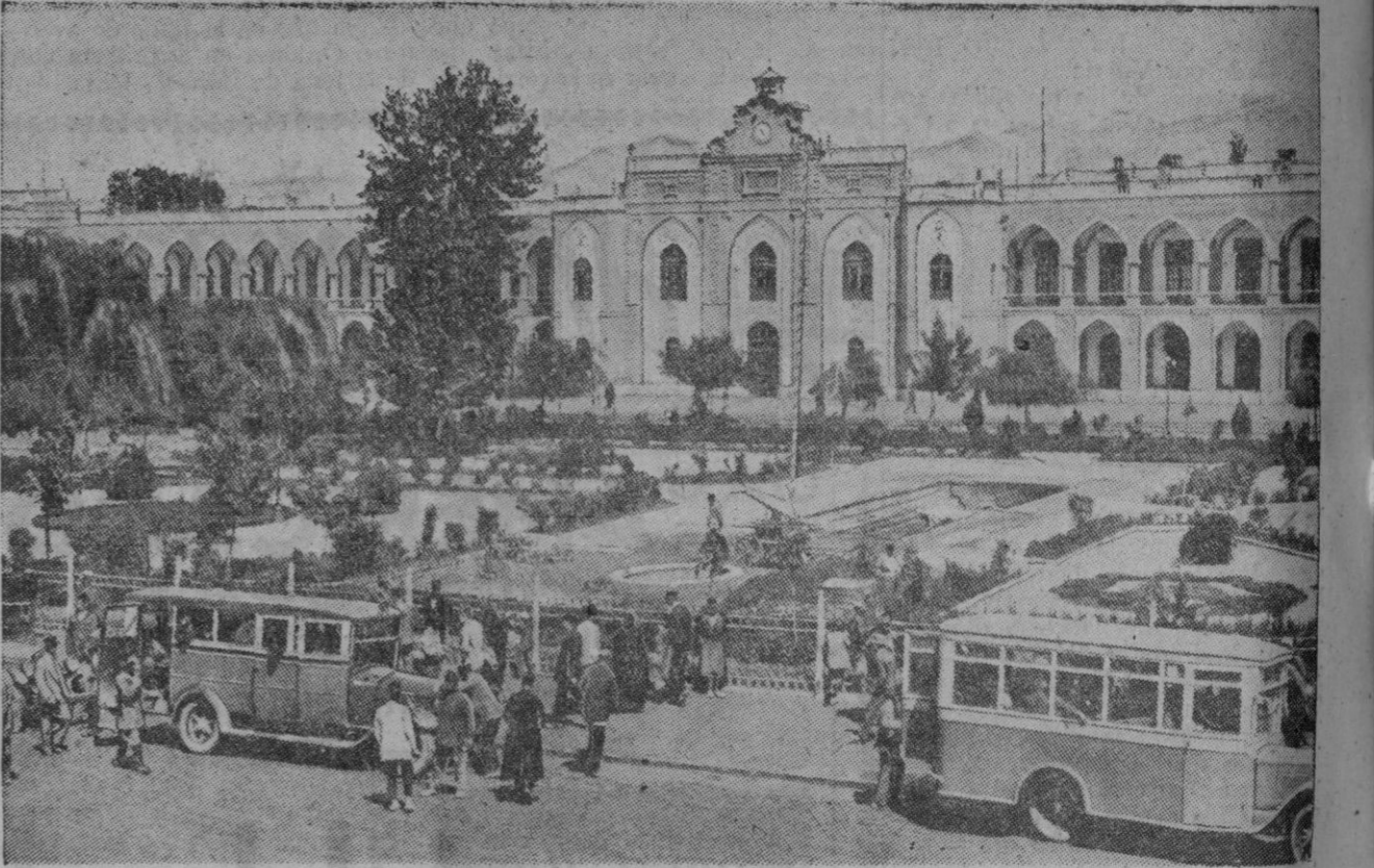
Esta es la plaza mayor de la ciudad de Teherán, en cuyo fondo destaca el edificio del Ayuntamiento. Nuevamente, como en la época de la nacionalización del petróleo, se ven las calles de la capital y de otras ciudades llenas del clamor de las turbas moviéndose en pro o en contra de la pureza constitucional y del trono.

Roma, 21 (Urgente).—El Sha de Persia ha salido de esta ciudad en un avión que despegó en las primeras horas de la mañana. Este avión le llevará a Bagdad, donde recogerá el aeroplano privado que utilizó el Sha para huir del Irán, en el que regresará a su país.