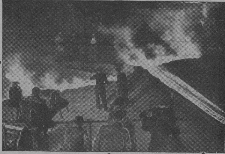
Los servicios informativos deben estar atentos a su misión. Ese celo lo demuestran esos operadores de televisión que, provistos de trajes especiales, están transmitiendo para el cómodo espectador la colada de acero en una fundición.