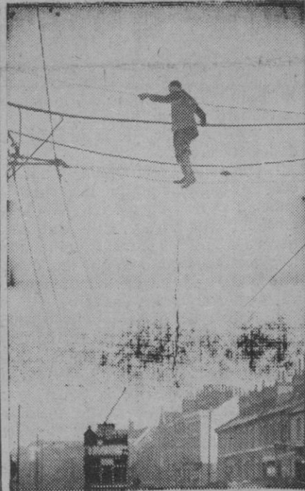
Este hombre, no es que esté exhibiendo simplemente su don de equilibrio. Se trata de un obrero que repara una rotura de un cable del tranvía.

Oviedo, 20.—La pesca del salmón está dando este año grandes rendimientos. Se llevan capturados más de doscientos de éstos en los ríos asturianos. En las pescaderías de Oviedo se vendió hoy a doscientas pesetas kilo.—Cifra.