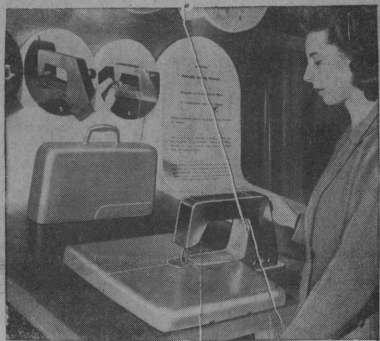
La electricidad ha influido, sobre todo en los últimos tiempos, en la manera de vivir. Su aplicación a la vida doméstica constituye una de las mayores transformaciones. En la foto vemos una máquina de coser portátil que funciona mediante electricidad y que es fácilmente transportable de un lugar a otro.