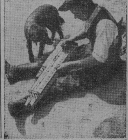
Este pastor es húngaro y muestra su cilara, que es una de las características más marcadas de este país. Indiscutiblemente melómmano que ha perdido su habitual alegría y tranquilidad desde que la guerra europea hizo presa de él.