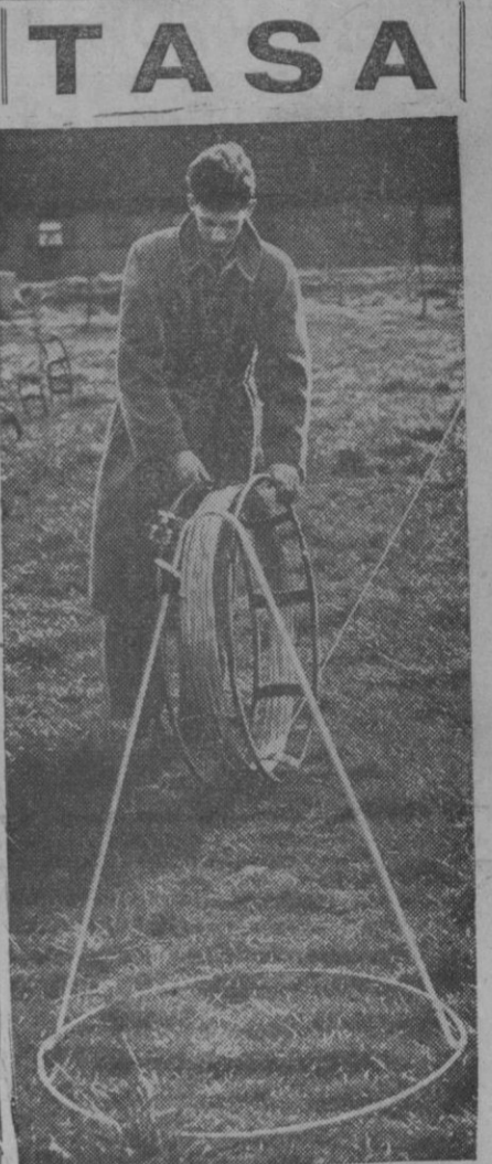
Para que el ganado no consuma mayor cantidad de pastos de la que le corresponde, se utiliza este tendedero de cables conductores de electricidad, que se cambian de sitio fácilmente.

La impresión de los técnicos y de los labradores es que, si de aquí a fin de mes no llueve en las tierras palentinas, todo lo que se retrasen las precipitaciones repercutirá en los cultivos. En las labores de barbechera que se realizan, la tierra sale como «tabaco» y en un punto de treinta centímetros resbala el arado como sobre una losa. De todas formas, habrá poca paja. Si lloviera aún en esta misma semana, podría esperarse una buena siega, pero de otra forma, especialmente en las zonas que apenas tocaron las nieves, se correrá un verdadero riesgo. En algunos terrenos, como en Frechilla y Villalón, la urgencia en recibir el agua se mide ya por días.—Cifra.