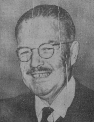
He aquí una de las más recientes fotografías del general Ibáñez, Presidente de la República chilena, que devolverá en breve la visita que el general Perón le hizo recientemente, de la que salieron fortalecidas las relaciones económicas de los dos países.