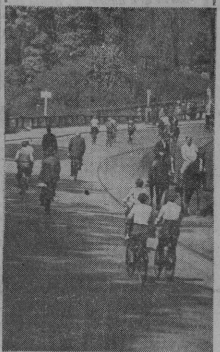
Por Pentecostés los habitantes de Kopenhagen salen con sus cestos bien repletos de viveres a los sitios verdes de los alrededores de la ciudad. Nuestra foto presenta toda una corriente continua de ciclistas que entran en el fresco y verdeante bosque de Klampenbor.