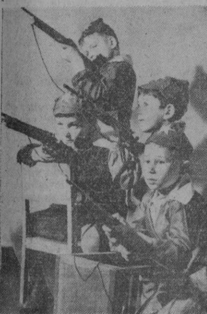
Estos niños demuestran prácticamente el estado de ánimo en que se educan, aprendiendo libremente a tirar con fusil en el Norte de Corea.