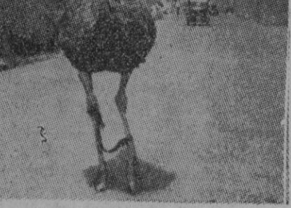
AVESTRUZ El avestruz es uno de los animales más veloces. El que ha retratado aquí el fotógrafo pertenece a un parque de los Estados Unidos y lleva las patas atadas, pero, a pesar de todo, costaría mucho trabajo cogerte a un hombre

Aunque los resultados oficiales no se conocerán al menos en dos semanas, los no oficiales indican que dos comunistas han sido derrotados en el departamento de Guatemala por sus adversarios antirrojos. Se añade que Fortuna, que es secretario general del partido comunista sólo ha sacado 8.000 votos, mientras que Jesús Luis Arenas ha logrado 20.000. Los resultados parecen indicar que los comunistas perderán un escaño en el Congreso de los cuatro que tenían.—Efe.