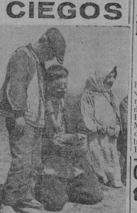
La fotografía no tiene nada de agradable. Se trata de unos ciegos que imploran la caridad pública en la vía pública en un país europeo.

Santa Cruz de Tenerife, 18.—Restablecidas completamente las comunicaciones telefónicas, al quedar expedita la carretera que estuvo interceptada por los árboles y los postes telefónicos, derribados por el fuerte viento, se van conociendo nuevas noticias relacionadas con el violentísimo temporal de viento y agua que azotó toda la isla en la madrugada del miércoles. La zona más afectada ha sido la del Valle Orotava, la cual presenta un aspecto desolador, pues fincas enteras han quedado arrasadas y otras con importantes daños. En una so'a finca que tenía seis mil plantones, quedaron en pie solamente setenta y dos. El temporal, aparte de destruir la producción agrícola isleña, ha causado graves daños en numerosas viviendas y varios templos, entre éstos la parroquia de la Concepción, monumento nacional, cuyas valiosas vidrieras llamaban la atención de los turistas, y que han quedado casi destruidas. Varias personas resultaron heridas al ser alcanzadas por muros derrumbados. A la entrada de la Orotava se ven numerosos árboles derribados y las casas de aquel lugar aparecen con las ventanas y puertas destruidas. Además del gobernador civil, han visitado la zona damnificada y escuchado las explicaciones de los técnicos, el capitán general, duque de la Torre, el presidente del Cabildo y el ingeniero jefe de la Jefatura Agronómica.