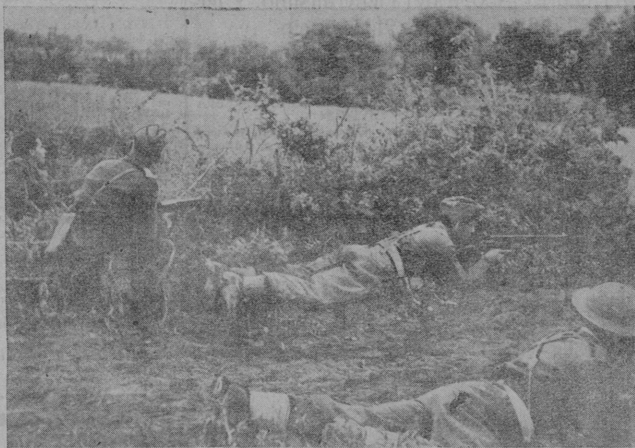
Tokio, 4 (C. t.).—Hoy se han reunido los oficiales de Estado Mayor aliados y comunistas, en Pan Mun Jom, poniéndose ambos bandos de acuerdo en la redacción del párrafo por el que se prohíbe a los prisioneros repatriados la participación en cualesquiera futuras hostilidades en Corea. Los rojos han accedido a dejar la redacción del párrafo como había sido originariamente concebida. Anteriormente habían pedido frases más detalladas. Como es sabido, hoy ha comenzado la segunda semana de suspensión de las reuniones de las delegaciones plenarias, a petición de los delegados aliados, que dijeron que los comunistas no habían llevado a la reunión de ayer domingo, nada nuevo.—Efe.

Las reuniones de los oficiales se aplazan nuevamente