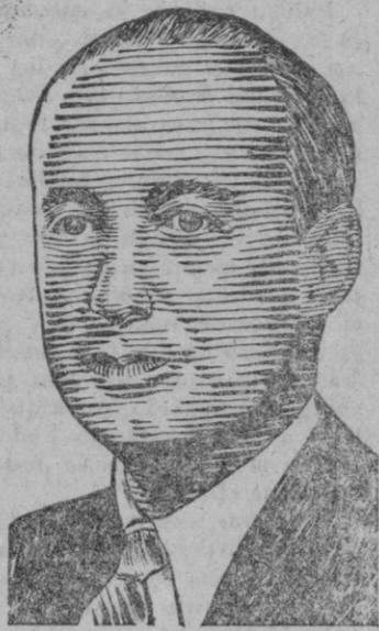
Adlai E. Stevenson, gobernador del Estado de Illinois

Y afirma que los demócratas ganarán también este año