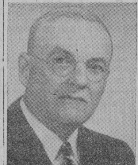
Foster Dulles, quien recientemente pronunció en París un discurso promocional, en el cual dijo que el Gobierno norteamericano debe hacer saber a la China comunista que los Estados Unidos se verán obligados a pelear fuerte en caso de agresión ulterior de los comunistas en Asia

De hacerlo se arruinaría la economía norteamericana