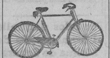
Bicicletas «G. A. C.», potente y veloz. Distribuidor exclusivo: CASA SOLERA RACES

CASA SOLERA, el palacio de las máquinas, les invita a escuchar hoy martes, a las 10,30 de la noche, por las antenas de Radio Segovia, el número 58 de su popular programa «Le esperamos en Segovia».