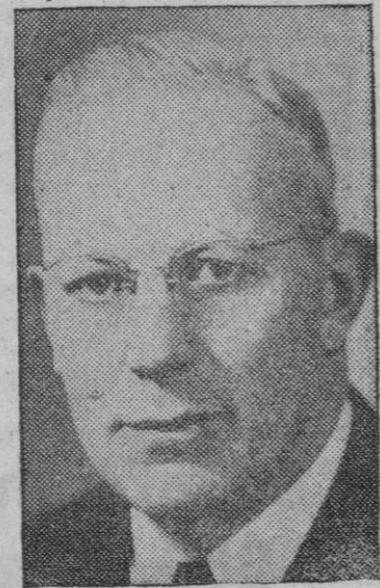
Earl Warren, gobernador del Estado de California