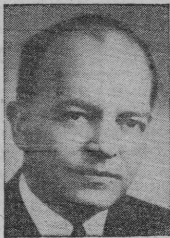
Harold E. Stassen, rector de la Universidad de Pensylvania