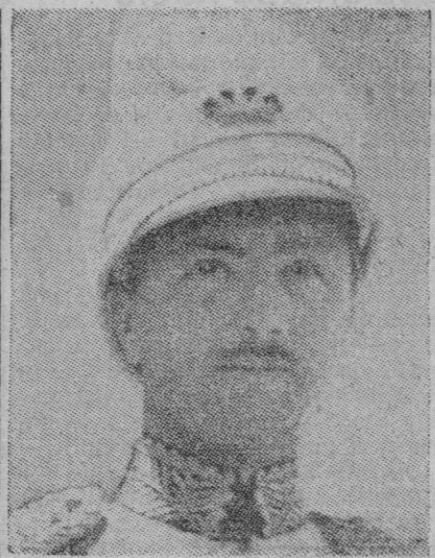
El Regente del Irak, Abdull-Ilah, que ha llegado hoy a Madrid

A las 17.56 sali6 para Madrid el Regente del Irak en el mismo coche cerrado que el que us6 el Jefe del Estado espaol. El Regente iba vestido de capit6n general, y el Regente uniforme kaki de jefe del Ej6rcito de su pa6s.