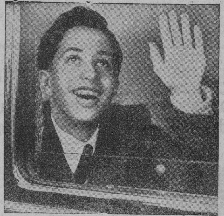
El Rey Faisal II del Irak, el Monarca m6s joven del mundo, que en 1954 llegar6 a su mayoria de edad, empezando entonces su reinado efectivo