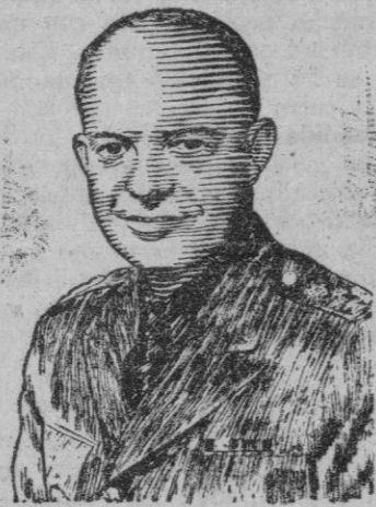
El general Eisenhower

Estos son los posibles candidatos republicanos