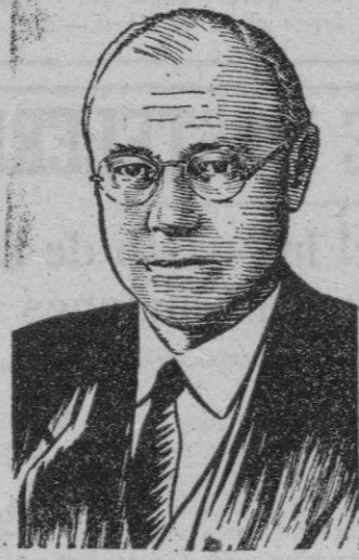
Robert A. Taft, senador por el Estado de Ohio