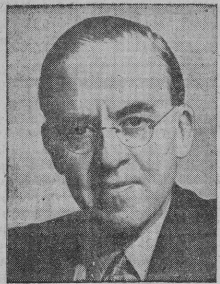
Sir Stafford Cripps

Zurich, 21.—Sir Stafford Cripps, ex ministro británico de Hacienda, ha fallecido hoy en esta ciudad.