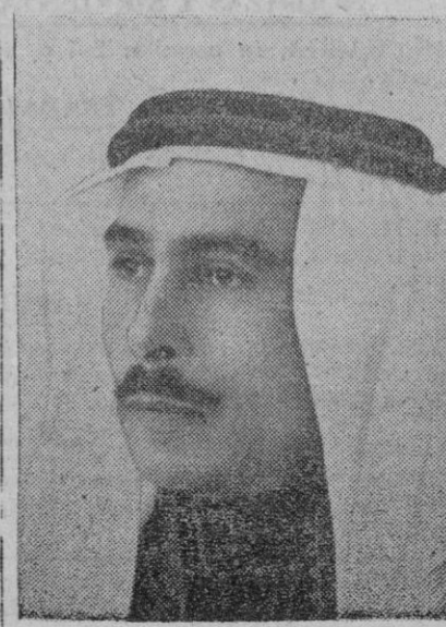
El Rey Talal I de Jordania

Amman, 15.—Acompañado por varios miembros del Gobierno jordano y autoridades de Bellas Artes del Reino, el ministro español de Asuntos Exteriores y su séquito han visitado Jerash, la antigua Gerasa, cuya