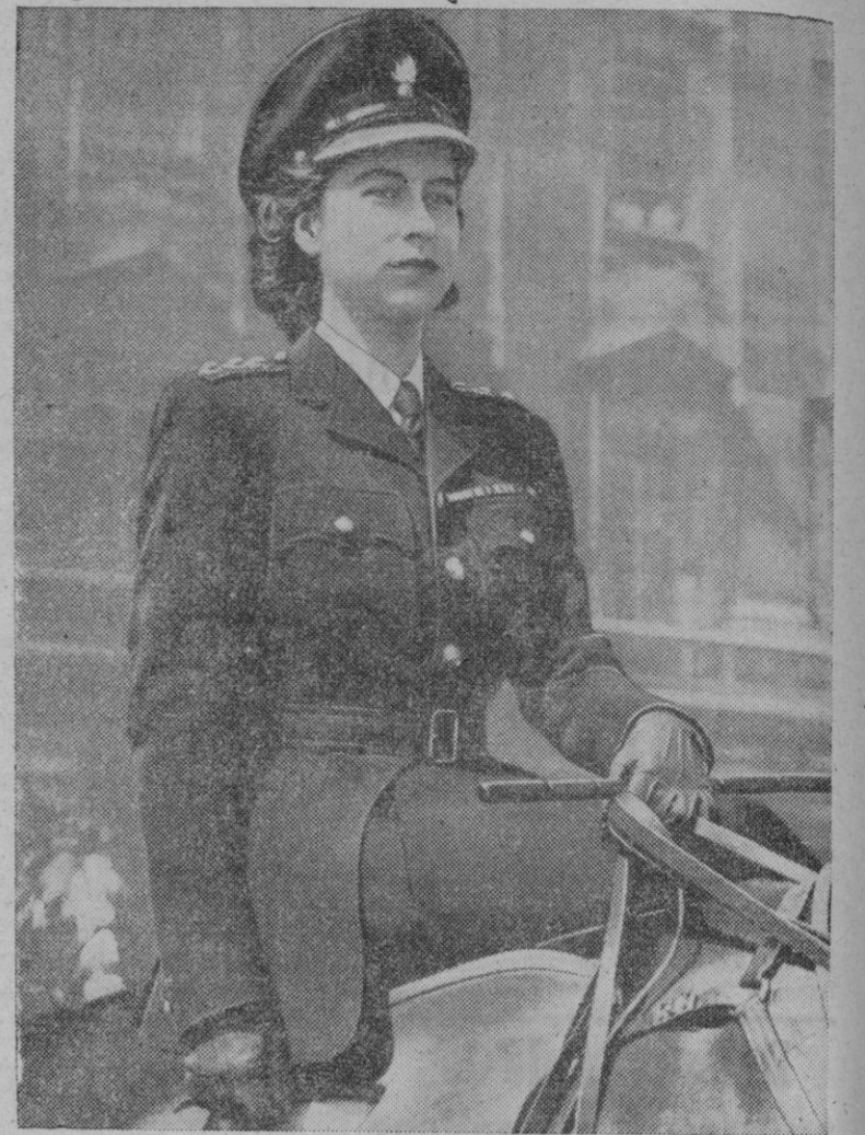
Estudio fotográfico de la nueva Reina Isabel de Inglaterra efectuado cuando siendo princesa se dirigía al desfile militar celebrado con motivo del cumpleaños de su agusto padre Jorge VI. Fue la primera vez que se mostró a caballo, en público