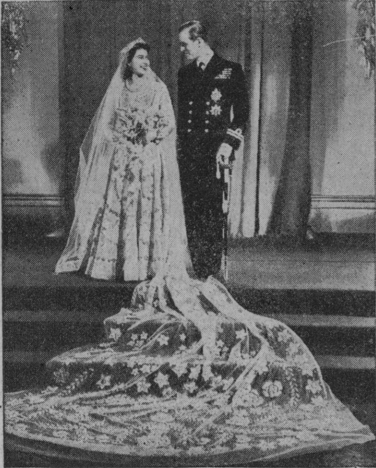
Fotografía de la nueva Reina Isabel de Inglaterra y de su esposo el duque de Edimburgo obtenida momentos después de su boda

En una sesión relámpago Winston Churchill informó a la Cámara de los Comunes de la muerte del Rey Jorge VI