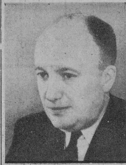
Jean van Houtte, nuevo presidente del Consejo de ministros de Bélgica