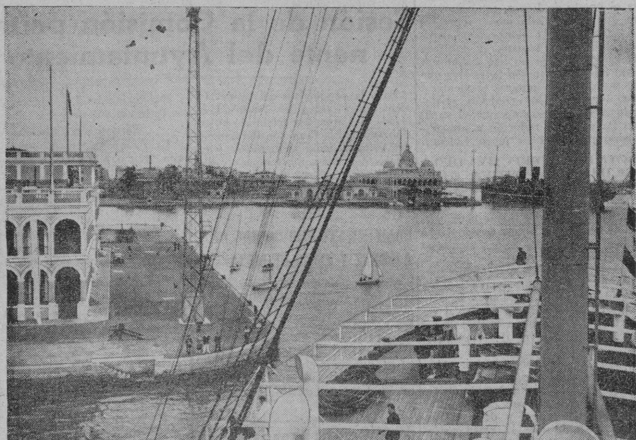
Una vista de la ciudad y el puerto de Port Said, en la entrada del canal de Suez, contra la cual ha disparado hoy sus cañones el crucero británico "Liverpool"

El crucero disparó sus cañones después de una batalla de cuatro horas entre tropas británicas y egipcias