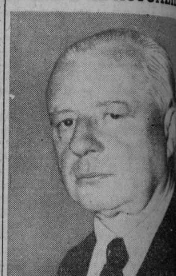
El antiguo coronel general alemán Hans Friesner, que ha sido designado jefe de la organización de excombatientes para toda la Alemania occidental