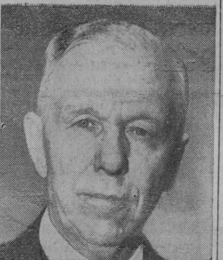
El general Marshall

París, 13 (5 t.).—La Prensa francesa se ocupa ampliamente de la dimisión del general Marshall. El periódico «L'Aurore» destaca en su titular que Marshall ha dimitido porque desaprobaba la política norteamericana en Asia. «La oposición de Marshall a cierta política de los Estados Unidos en Extremo Oriente, no es ningún secreto. El fracaso de las negociaciones del armisticio en Corea puede muy bien haberle hecho tomar, cuando en el próximo futuro los norteamericanos y chinos lancen una nueva y violenta ofensiva, la postura defendida por Mac Arthur por el color auge. Marshall ha preferido permanecer en su puesto para tener que ver cómo se aplica-