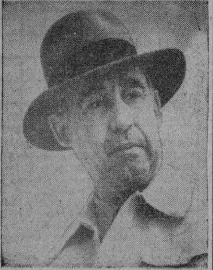
El general don Francisco Craveiro Lopes, elegido recientemente Presidente de la República portuguesa