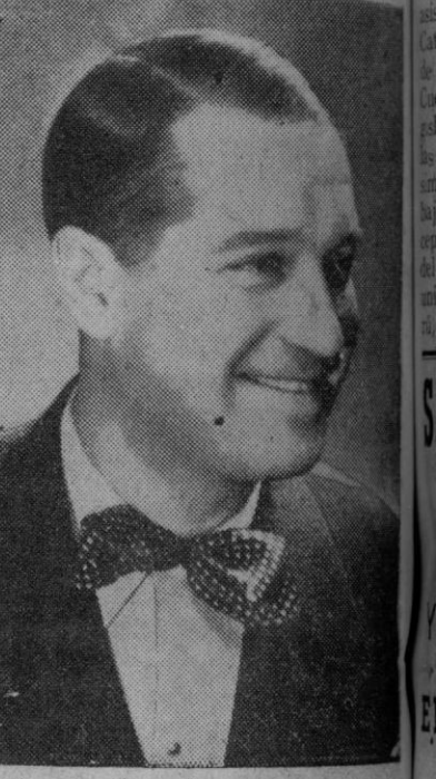
Maurice Chevalier

No se le concede visado de entrada en EE. UU.