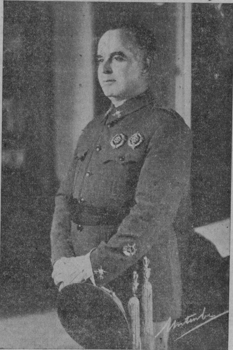
Fotografía del teniente general don José Varela, obtenida en los días en que ejerció la jefatura del frente del Guadarrama, poco después de ganar la larga y cruenta batalla de "Cabeza Grande", y establecido ya su cuartel general en Segovia

vincia noticia tan luctuosa, rendimos póstumo testimonio de gratitud a la insigne figura del teniente general Varela, y enviamos a su ilustre esposa e hijos y demás deudos el más sincero testimonio de nuestra condolencia, rogando a nuestros lectores