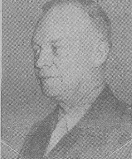
El general Eisenhower

También están de acuerdo en establecer un mando común del occidente europeo contra una nueva agresión comunista