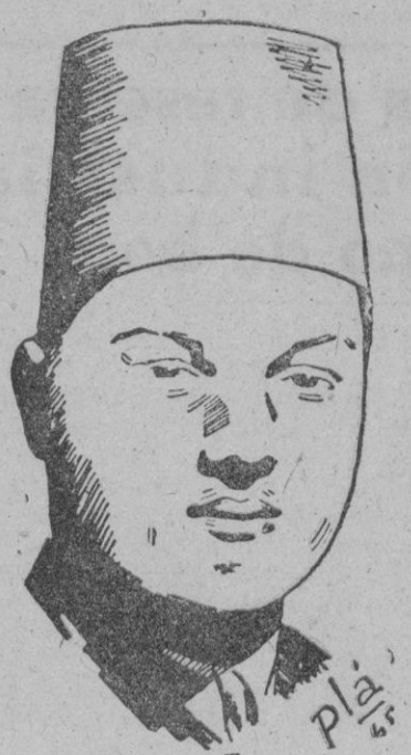
El Rey Faruk

Biarritz, 11 (1 t).—El Rey Faruk, de Egipto, ha salido en automóvil para San Sebastián. Después de una estancia de varios días en España, regresará a esta ciudad francesa.—Efe.