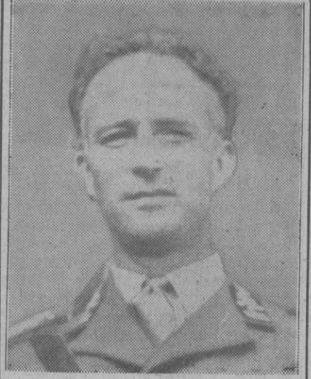
Reciente fotografía de Leopoldo III

Bruselas, 11 (4 t.).—Dos grupos de estudiantes, unos socialcristianos y otros socialistas, han tenido un encuentro a primera hora de hoy, en el centro de esta capital. Entre los estudiantes de ambos grupos se intercambiaron bombas de humo y, más tarde, llegaron a los puñetazos, a los gritos de «viva el Rey Leopoldo» y «abdicación», que profirieron los distintos bandos. La Policía cargó contra los dos grupos con porras de goma y detuvo a doce estudiantes. Anteriormente, los estudiantes socialistas arrojaron bombas de humo en un gran salón de baile donde se celebraba un mitin en favor del Rey Leopoldo. El público se vio obligado a salir a la calle, donde fue recibido con gritos contrarios a su ideología. Después de unos diez minutos, y una vez disipado el humo, la reunión volvió a continuar.