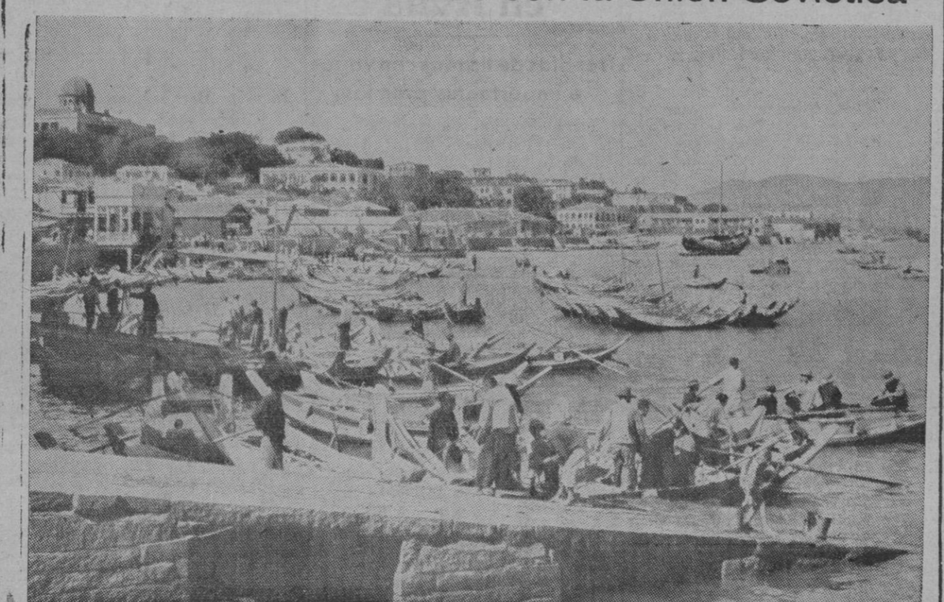
Una vista del puerto chino de Amoy, en Kulangsu, por la posesión de cuya ciudad se lucha encarnizadamente en la actualidad

Tiene fronteras comunes con la Unión Soviética