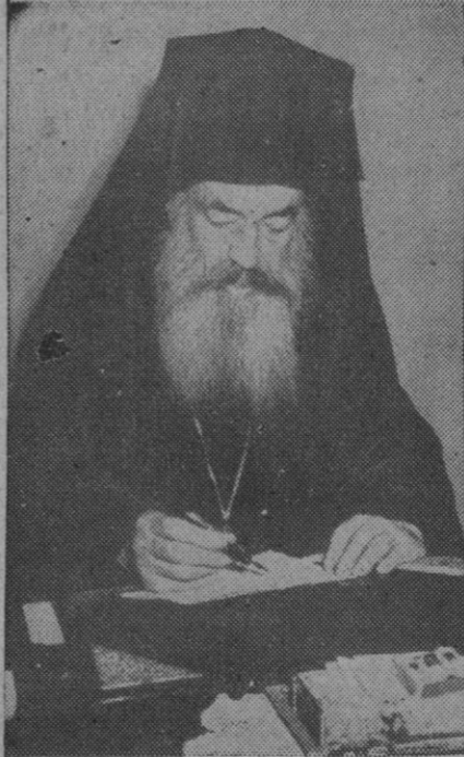
Spiridolos Vlahos, obispo de Yanina, arzobispo de la iglesia ortodoxa, sucesor del arzobispo Damaskinos fallecido recientemente