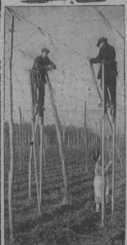
En los campos dedicados al cultivo del lupulo en Kent, los obreros encaramados en altos zancos atan las cuerdas de los postes para preparar los soportes de la próxima cosecha. Este procedimiento se usa desde hace varios siglos.