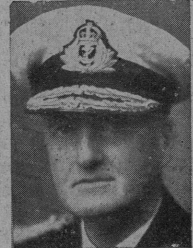
El almirante inglés lord Fraser

Fraser ha interrumpido una conferencia naval sobre unos ejercicios proyectados para la semana que viene. (Lo primero que hay que hacer—dijo—es determinar nuestra conducta frente a este hecho. Mi opinión es que debe dejarse a la iniciativa del jefe naval que está sobre el terreno, excepto en lo que respecta a la ayuda que podamos dar. Lo primero que haremos nosotros es informar al Fo-