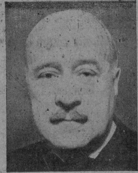
El diplomático francés André François-Poncet, sucesor del conde Folke Bernadotte como presidente de la comisión permanente de la Conferencia Interamericana de la Cruz Roja.