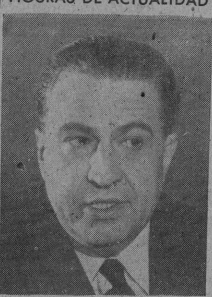
El doctor Torres Bodet, nuevo director de la UNESCO.