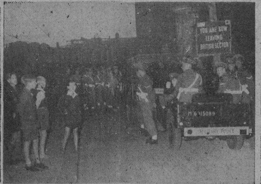
He aquí a la Policía inglesa y norteamericana, en el momento de llegar a la frontera de su sector con el soviético, en Berlín, para mantener el orden.

Esta tarea sería encomendada a una serie de cuarteles generales