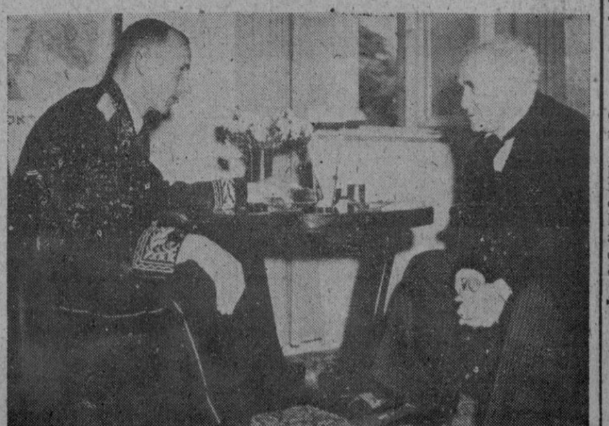
La foto recoge el momento de presentar sus cartas credenciales al primer ministro de Israel, David ben Gurion, el enviado extraordinario de los soviets, que por cierto, viste un flamante uniforme bordado, no muy "proletario"