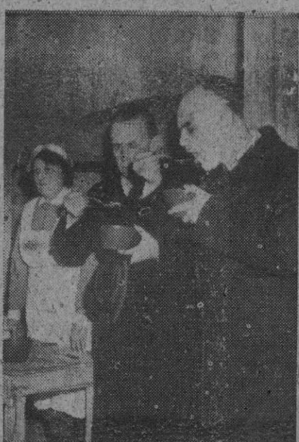
El presidente de la Cruz Roja Internacional de Suecia, Folk Bernadotte —el primero a la derecha— probando la comida de una institución para socorrer a los hambrientos de Europa

Lake Success, 25 (4 t.)—Las Naciones Unidas hacen sus preparativos para enviar a Folk Bernadotte, presidente de la Cruz Roja sueca, a Palestina, para que se haga cargo de su puesto como mediador especial en el problema de Tierra Santa. El secretario general de las Naciones Unidas, Trygve Lie, ha pedido a los siete Estados árabes, al alto Comité árabe, al Gobierno provisional de Israel y a la Gran Bretaña, salvoconductos y garantías para Bernadotte. Un avión especial de las Naciones Unidas, contratado con las líneas holandesas K. L. M., partirá en breve hacia Tel Aviv, desde Holanda, para recoger a Bernadotte y sus auxiliares. El avión permanecerá a disposición de Bernadotte por todo el tiempo que lo necesite. El aparato llevará insignias de la Cruz Roja, con las palabras «Naciones Unidas», pintadas en inglés y en francés en sus alas.—Efe.