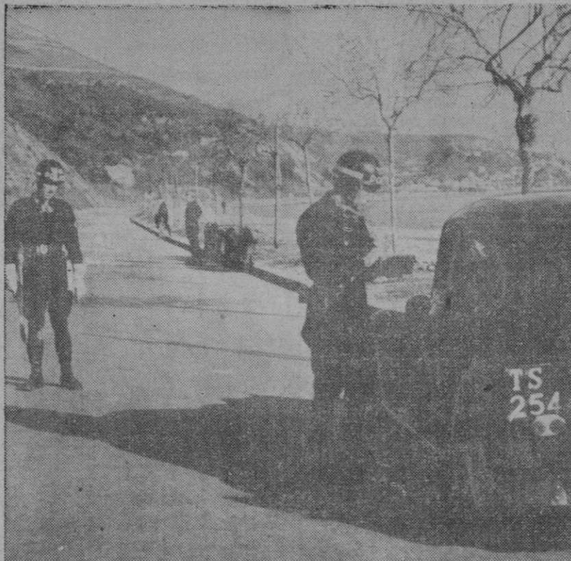
Cerca de cinco mil hombres, especialmente instruidos, se encargan de mantener el orden en el territorio de Trieste, del que se quiso hacer una zona libre, pero que será devuelto a Italia, según promesa de los Estados Unidos, Inglaterra y Francia. He aquí una patrulla de ese contingente armado guardador de la tranquilidad pública, en plena vigilancia sobre la ruta que conduce al gran puerto del Adriático

Entrega de notas de Estados Unidos e Inglaterra a Yugoslavia