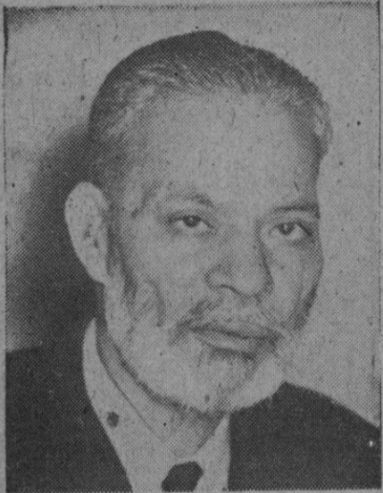
Sir Mohamed Zafrullah Khan, ministro de Negocios Extranjeros del Pakistán, que ha defendido a su país en el Consejo de Seguridad de la Naciones Unidas

Washington, 12 (1 t).—En la reunión del Consejo Federal de Iglesias, y ante la presencia del Presidente Truman, el secretario de Estado norteamericano, George Marshall, ha declarado que «el mundo se halla en plena gran crisis, inflamado por la propaganda, malentendidos, cóleras y temores. En medio de todo esto, y complicado por las distracciones de la campaña electoral, es importante expresar los sentimientos personales sobre la situación en términos moderados».