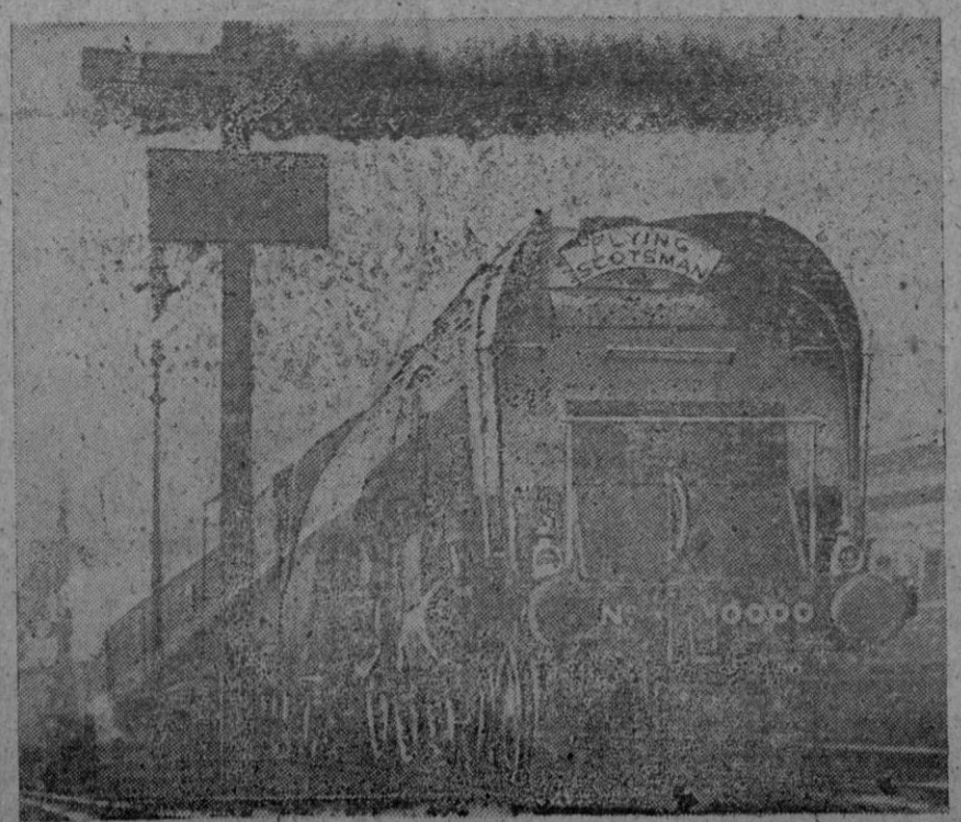
El primero de Enero fueron nacionalizados los ferrocarriles ingleses. Y poco a poco, cuando el material nuevo sustituya al viejo, desaparecerán los antiguos nombres de los más importantes trenes, como el Great Western L. N. E. R. En la foto puede verse al más conocido de sus trenes, el Ernie Scotsman.