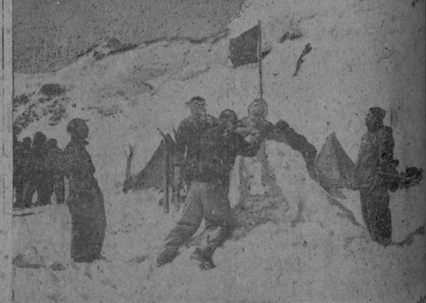
Una sociedad cinematográfica inglesa está filmando una película sobre la expedición al polo Sur, llevada a cabo por el explorador Scott. Las escenas de la cinta, más difíciles, fueron tomadas en un glaciar, durante una tempestad de nieve. La foto recoge el momento de ser izada la bandera de la expedición