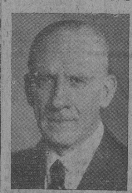
Sir Robert Robinson, a quien en 1947 se otorgó el Premio Nobel de Química por sus investigaciones, especialmente sobre alcaloides.