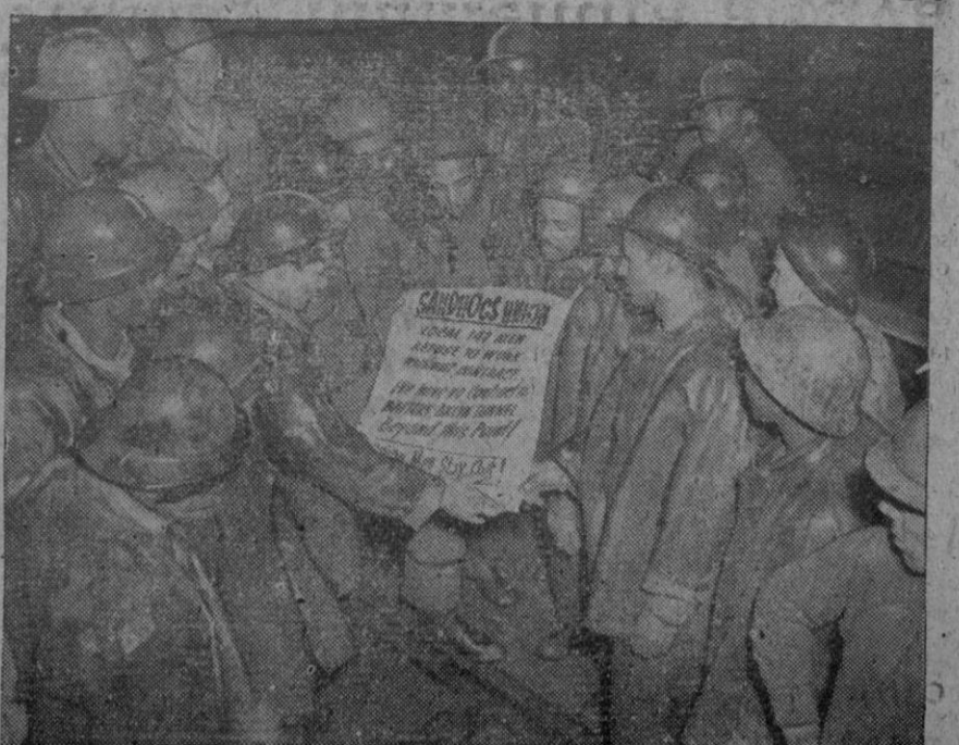
Los obreros empleados en la construcción del túnel Battery Brooklyn (Estados Unidos) reciben de su organización la orden de declararse en huelga. La organización exige un aumento de salario de 25 céntimos por cada hora de trabajo y medidas de seguridad en el mismo.